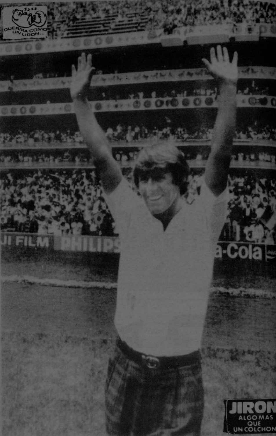
Bora Milutinovic director técnico de la selección de México, comparte el sueño de la afición mexicana, y espera que la copa se quede ahí.

MEXICO. (ANSA).- El atacante mexicano, Javier Aguirre, intentó hoy parar en seco a comentaristas, dirigentes deportivos y periodistas que han tratado de colocar una "aura de campeón" a México, tras su victoria