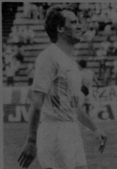
Marco Tardelli: Bearzot lo llevo a pasear