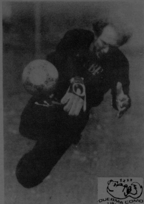
QUERMA COMO UN LIRÓN...

Por su parte Junior, que también juega en el campeonato italiano, dijo que Italia cometió el error "de no meter desde un principio a Di Gennaro, ya que de esa forma el equipo no tuvo creatividad y cuando el jugador ingresó en el segundo tiempo ya era demasiado tarde".