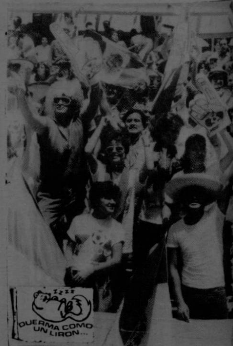
Los fanáticos mexicanos están eufóricos, y ya ven a su seleccionado disputando la final. Javier Aguirre les recuerda "poner los pies en la tierra".

Sin embargo, Javier Aguirre, que ha tenido un excelente desempeño en las actuaciones de su representativo, dijo que "es importante haber llegado a los cuartos de final", advirtiendo con seriedad que "todo lo que venga después será ganancia".