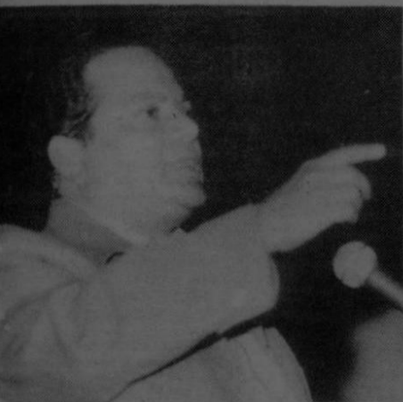
Monge destacó en Europa el peligro de Nicaragua

Monge, en su conferencia de 40 minutos, habló también del tema de la independencia sin libertad, sin justicia y sin paz y de la necesidad de una alianza de Europa con América Latina para salvar la democracia y la paz.