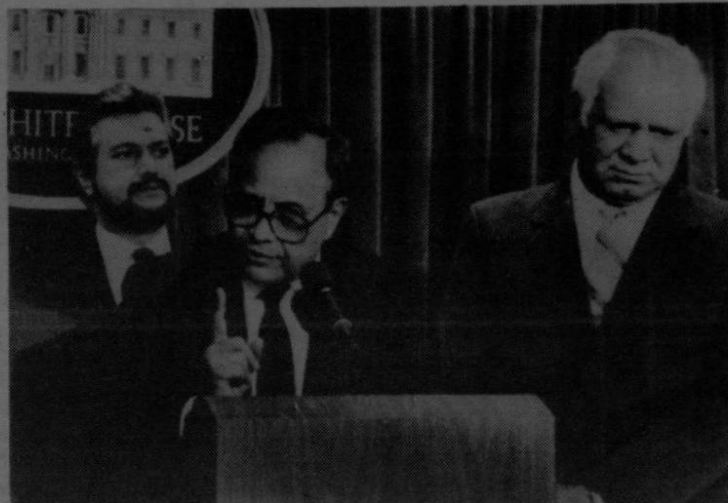
Líderes de la contra durante una conferencia de prensa en la Casa Blanca después de reunirse con el presidente Ronald Reagan, con el propósito de pedir con urgencia la ayuda de los 100 millones de dólares al Congreso. De la izquierda hacia la derecha: Alfonso Robelo, Arturo Cruz y Adolfo Calero.

Por su parte el excomandante guerrillero Edén Pastora, anunció ayer que trabaja en la organización de un movimiento político independiente que se convierta en alternativa real al gobierno actual de Nicaragua.